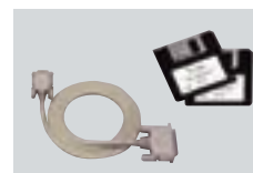
RS-R8500 RS-R8500 SOFTWARE DE CONTROL REMOTO Controla el IC-R8500 remotamente desde una PC compatible con IBM®. IBM® es una marca registrada de International Business Machines.