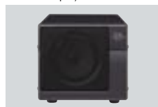
SP-21 PARLANTE EXTERNO Impedancia de entrada: 8 Ω Máxima potencia de entrada: 5W