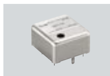
CR-293 UNIDAD DE CRISTAL DE ALTA ESTABILIDAD Estabilidad de frecuencia: ±0.5 ppm de 0°C a +60°C