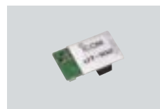
UT-102 UNIDAD DE SINTETIZADOR DE VOZ Ofrece la confirmación audible al acceder una banda de frecuencia.