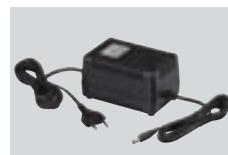
AD-55/A/V ADAPTADOR DE CA Permite alimentar el receptor por medio de CA doméstica.