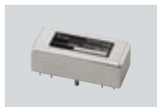
FL-52A FILTRO PARA CW ANGOSTA Frecuencia central: 455 kHz Ancho de banda: 500 Hz/-6 dB