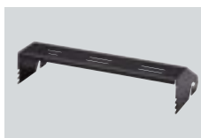
IC-MB12 SOPORTE DE MONTAJE MÓVIL Soporte de montaje del receptor para operación móvil.