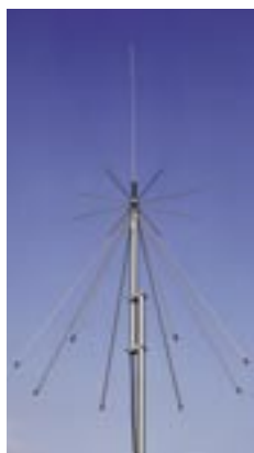
AH-7000 ANTENA OMNI DIRRECCIONAL DE BANDA SÚPER ANCHA Cobertura de frecuencia 25-1300 MHz

Las opciones disponibles pueden variar de acuerdo al país.