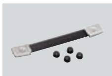
MB-23 MANIJA PARA TRANSPORTAR Para facilitar su transporte.