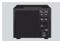
SP-23 PARLANTE EXTERNO 4 filtros de audio; conector para audífonos. Impedancia de entrada: 8Ω. Máxima potencia de entrada: 5W. (No está disponible en países de la Unión Europea)